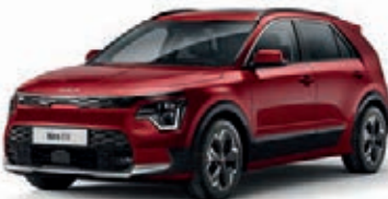
Runway Rot Metallic (CR5)