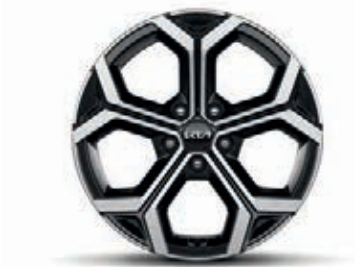
18-Zoll-Leichtmetallfelgen, nur für Spirit (Hybrid und Plug-in Hybrid)