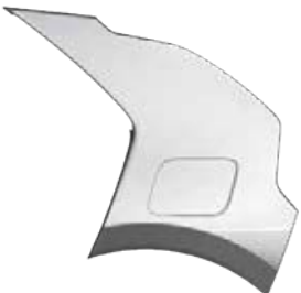
Stahlgrau Metallic (KLG), nur für EV