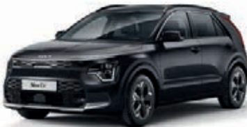
Auroraschwarz Metallic (ABP)