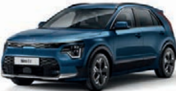
Mineralblau Metallic (M4B)