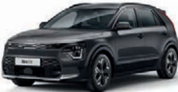
Interstellar Grau Metallic (AGT)