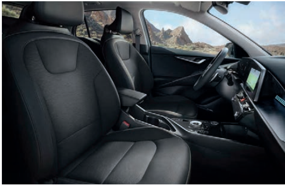
Sitzbezüge in hochwertiger Ledernachbildung, Charcoal (CCV) (Spirit und Inspiration).