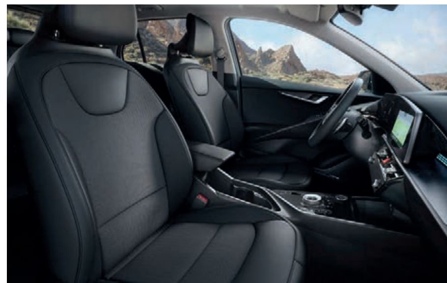
Sitzbezüge in Stoff-Leder- Kombination (mit hochwertiger Ledernachbildung), Charcoal (CCV) (Vision).