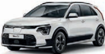
Snow White Pearl (SWP)