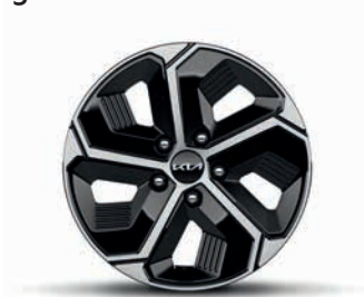
16-Zoll-Leichtmetallfelgen, serienmäßig bei Hybrid und Plug-in Hybrid