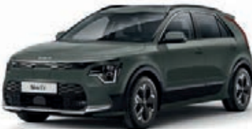
Cityscape Grün Metallic (CGE)