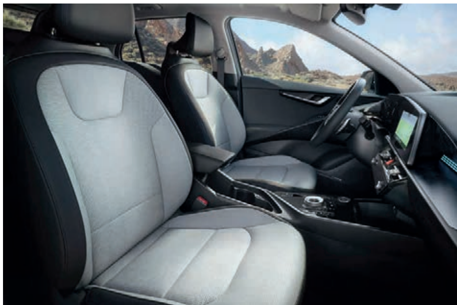
Sitzbezüge in hochwertiger Ledernachbildung, Bright (GYT) (optional für Spirit und Inspiration).