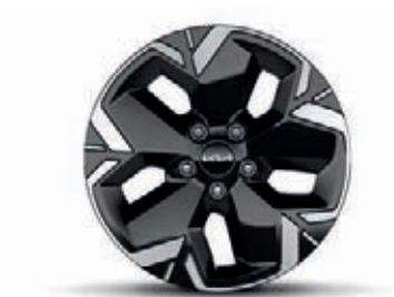
17-Zoll-Leichtmetallfelgen, nur für EV