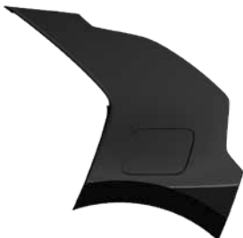
Auroraschwarz Metallic (ABP)