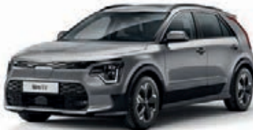
Stahlgrau Metallic (KLG)